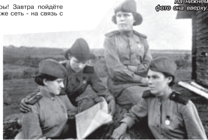
На нижнем фото она вверху.

Потомкам: Берегите Родину! Это, кроме близких и родных, самое святое.